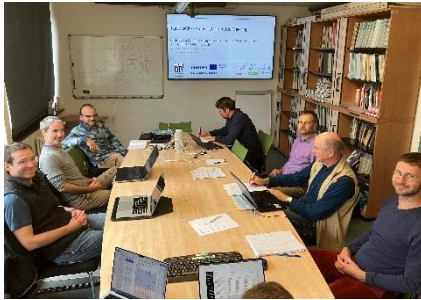
Treffen Lenkungsausschuss, 07.10.24