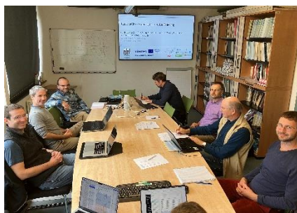
réunion du comité de pilotage, 07/10/24